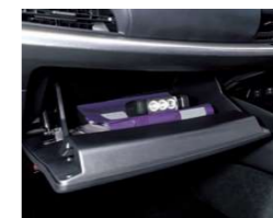
グローブボックス