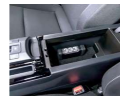
コンソールボックス