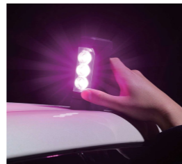
マグネットで車両に簡単設置可能※2

※2.樹脂・アルミ・カーボンなどの素材にはマグネットによる設置はできません。 ※車両側面には設置しないでください。