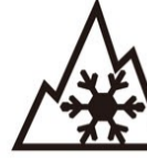
スノーフレックマーク

ASTM®の公式試験で、極めて厳しい寒冷地でも十分な性能を発揮することを認証された証です。日本でもチェーン規制時に走行可能な冬用タイヤとして認められています。