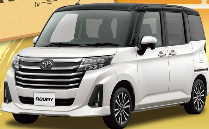
Photo: 新型ルーミー カスタムG-T (2WD・CVT) 車両本体価格 2,046,000円(消費税込) ※写真のボディカラー、ブラックマイカメタリック<X07>×パールホワイトⅢ<W24>[X99]77,000円(消費税込)はメーカーオプションとなり、車両本体価格に含まれておりません。

ももくりプラン 残価率37% 5年間ラクラクお支払い なら 60回払い 月々 7,800円