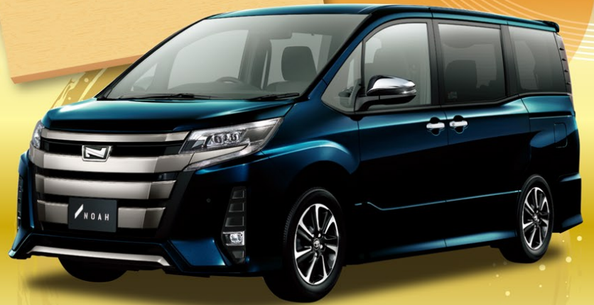
Photo: ノア Si"W×BⅢ" (7人乗り・2WD・CVT) 車両本体価格 2,940,300円(消費税込) ※写真のボディカラー、ブラックツッシュアゲハガラスフレック(221)33,000円(消費税込)はメーカーオプションとなり、車両本体価格に含まれておりません。

ももくりプラン 残価率17% 7年間ラクラクお支払い なら 84回払い 月々 21,300円