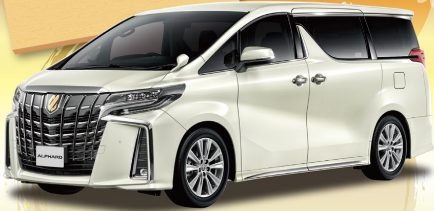
Photo: アルファード S"TYPE GOLD" (7人乗り・2WD・CVT) 車両本体価格 4,240,000円(消費税込) ※写真のボディカラー、ラグジュアリーホワイトパールクリスタルシャインガラスフレック(086)33,000円(消費税込)はメーカーオプションとなり、車両本体価格に含まれておりません。

ももくりプラン 残価率22% 7年間ラクラクお支払い なら 84回払い 月々 34,600円