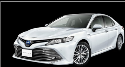
Photo:G“レザーパッケージ”。ボディカラーのプラチナホワイトパールマイカ(089) <32,400円>はメーカーオプション。パノラマムーンルーフ<140,400円>はメーカーオプション。ブラインドスポットモニター、リヤクロストラフィックアラート、インテリジェントクリアランスソナー(リヤクロストラフィックオートブレーキ機能付)はセット<92,880円>でメーカーオプション。