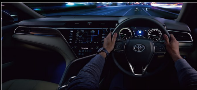
Photo:G“レザーパッケージ”。ボディカラーはシルバーメタリック(1F7)。内装色のベージュは設定色(ご注文時に指定が必要です。指定がない場合はブラックになります)。ブラインドスポットモニター、リヤクロストラフィックアラート、インテリジェントクリアランスソナー(リヤクロストラフィックオートブレーキ機能付)はセットでメーカーオプション。■写真は機能説明のために各ランプを点灯したものです。実際の走行状態を示すものではありません。■写真は機能説明のためにボディの一部を切断したカットモデルです。■画面はハメ込み合成です。